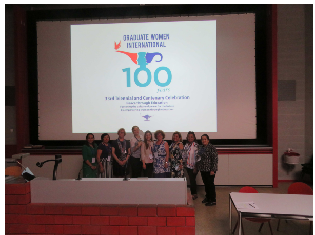
Avec la section de El Salvador, avec laquelle nous avons établi des liens pour une collaboration concrète et fructueuses, concernant les droits des femmes dans leur pays.