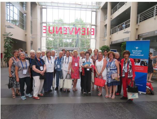
Toutes les représentantes suisses des sections cantonales.