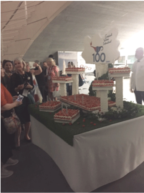
Le gâteau du 100naire de GWI !