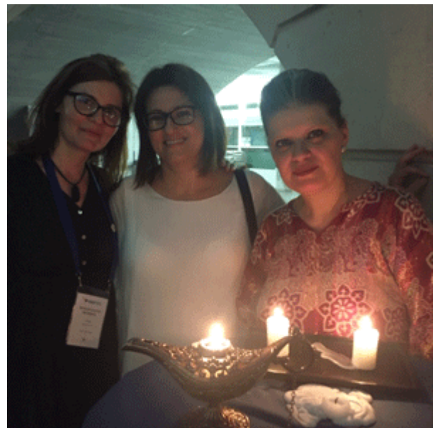
2. Scènes de la célébration du 100naire GWI, dans le bâtiment de l'UNI Mail, le 25 juillet.